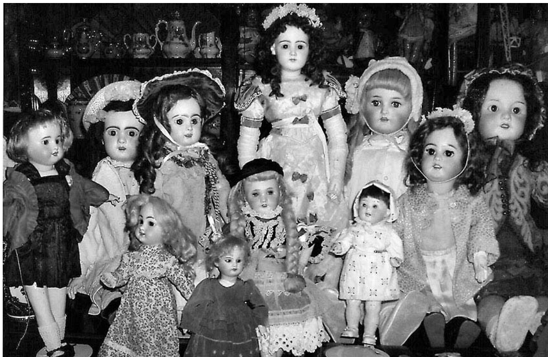
La obra de Silvia Marques se fija en la cuidadosa fabricación de antiguas muñecas.

Pasando del plano general al mismo detalle de la exposición, el visitante conocerá antigüedades inglesas, arte africano y japonés, fruslerías, joyas antiguas y objetos de escaparate, lustres y farolas, muebles y arte decorativo del siglo XX, obras de artistas cubistas, esculturas, bibliotecas, alfombras y un largo etcétera de objetos y materiales que no